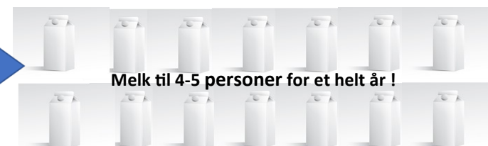
Melk til 4-5 personer for et helt år !