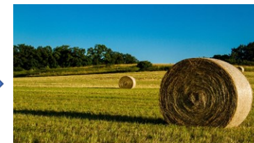
1 rundballe gir ca 750 kg fôr