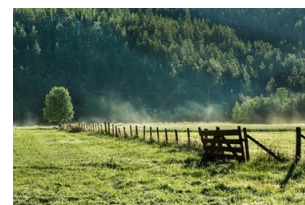
1 da gir ca 1,5 rundballe