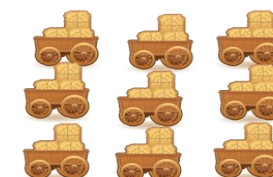
18,75 porsjoner fôr pr dag