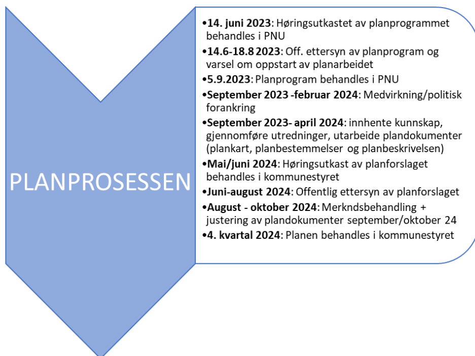
Figur 2: Planprosessen

Forberedende fase ble iverksatt med en orientering i plan og næringsutvalget (PNU) den 14. februar 2023.