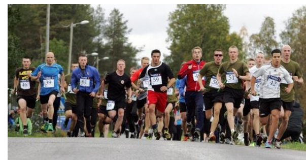
Kamp om god posisjon i starten av Måselvstafetten 2013

FOR 8. GANG ØNSKER VI VELKOMMEN TIL STOR LØPSFEST PÅ RUNDHAUG I MÅSELV.