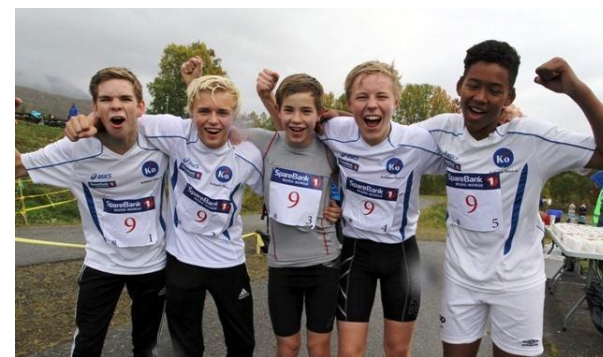
Glade vinnere fra Måselv IL friidrett etter seier i kl. gutter 14-16 år 2013

BRIGADESTAFETT UNGDOMSSTAFETT LABB OG LINE BARNELØP www.malselvstafetten.net